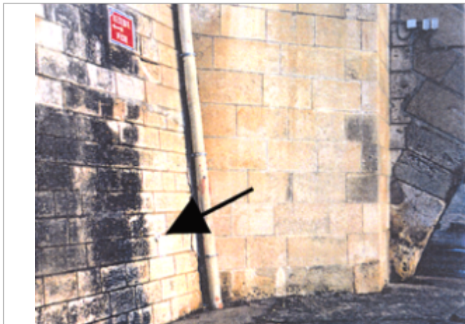
Vue du site BDHE 19 point de repère 21.