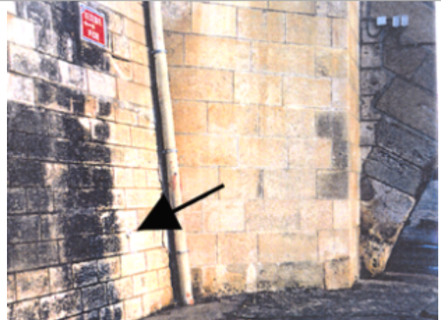
Vue du site BDHE 19 point de repère 21

Coordonnées WGS84 : X: 3.01472207 / Y: 47.17764080