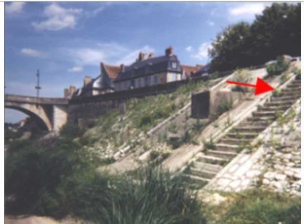
Vue du site BDHE 18 point de repère 23

Coordonnées WGS84 : X: 3.01498597 / Y: 47.17701960