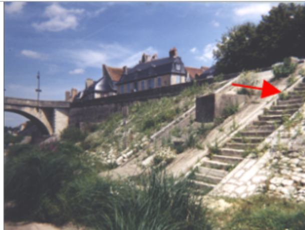
Vue du site BDHE 18 point de repère 23