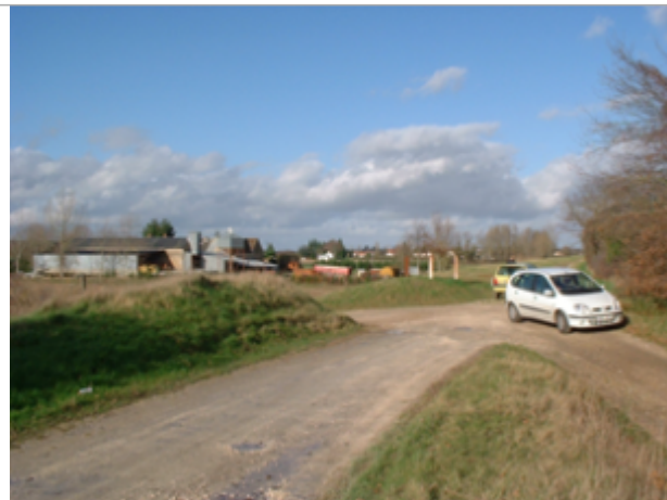
Vue du site BDHE 15 point de repère 17