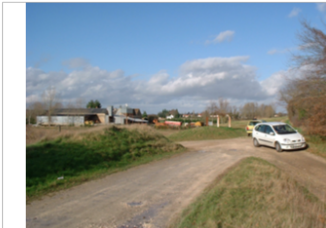
Vue du site BDHE 15 point de repère 17

Coordonnées WGS84 : X: 3.01594433 / Y: 47.15847360