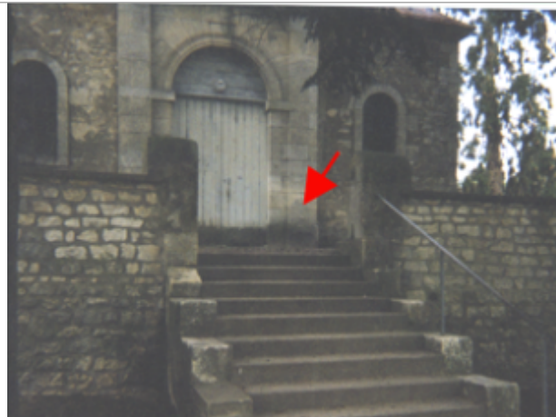
Vue du site BDHE 14 point de repère 15