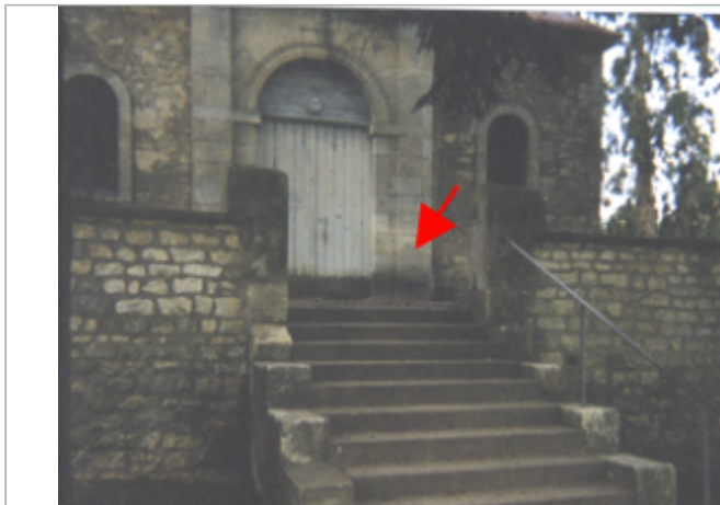
Vue du site BDHE 14 point de repère 15