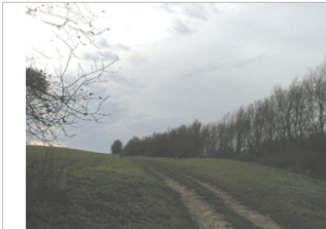
Vue du site BDHE 13 point de repère 585