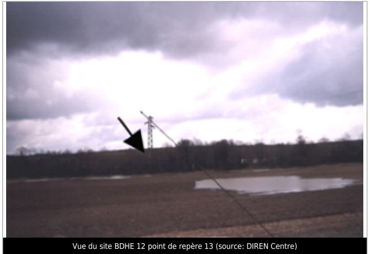
Vue du site BDHE 12 point de repère 13

Coordonnées WGS84 : X: 3.02838264 / Y: 47.09261420