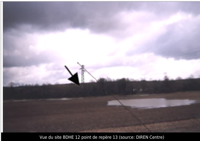
Vue du site BDHE 12 point de repère 13