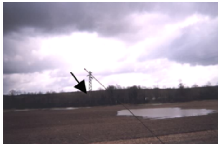
Vue du site BDHE 12 point de repère 13