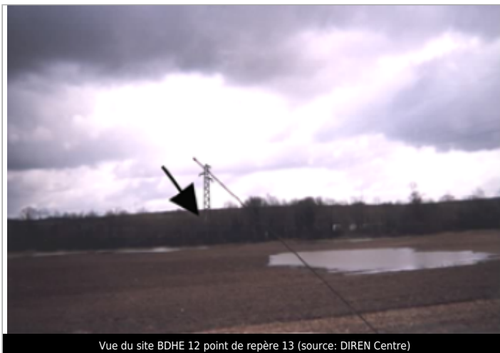
Vue du site BDHE 12 point de repère 13