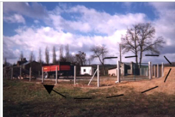
Vue du site BDHE 11 point de repère 12