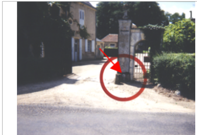
Vue du site BDHE 10 point de repère 11.