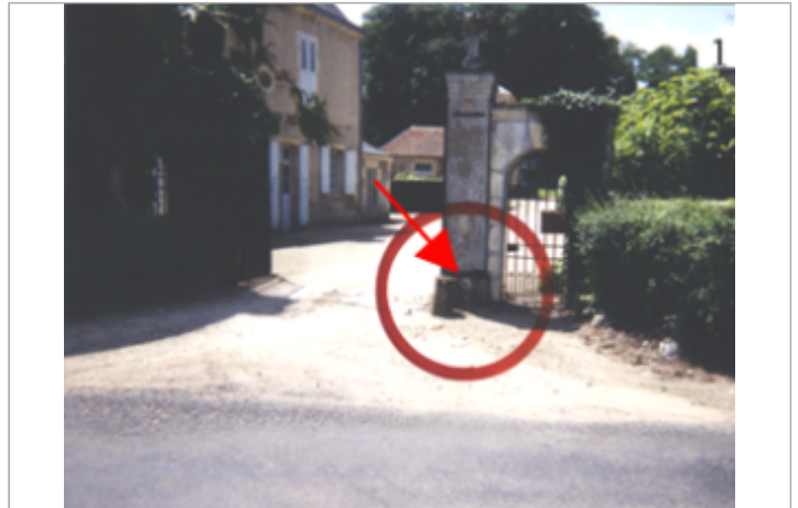
Vue du site BDHE 10 point de repère 11.