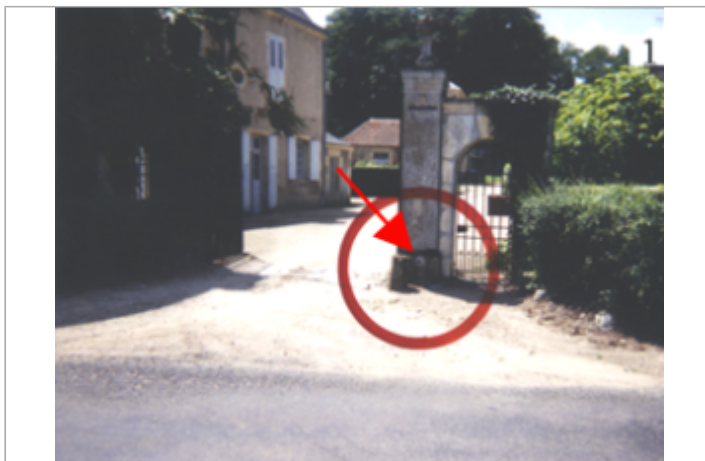
Vue du site BDHE 10 point de repère 11.