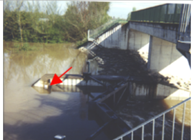
Vue du site BDHE 8 point de repère 9