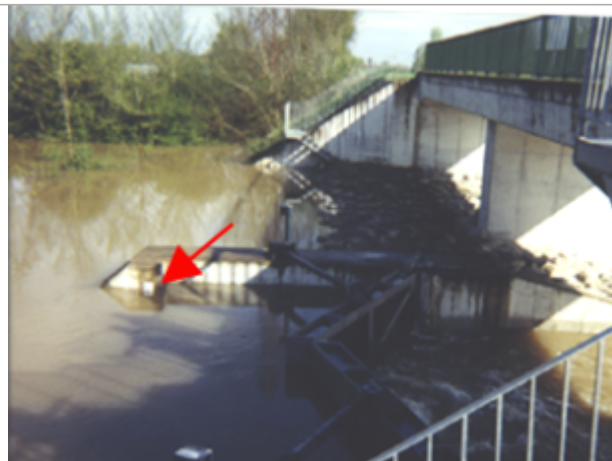
Vue du site BDHE 8 point de repère 9