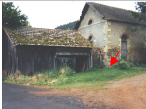
Vue du site BDHE 7 point de repère 8