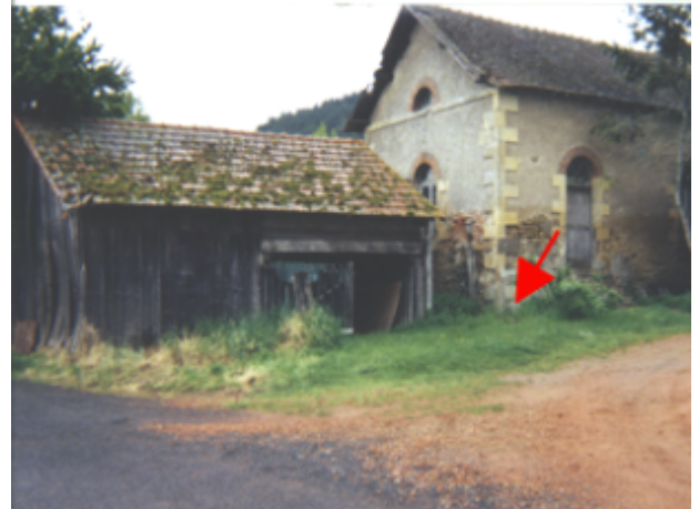
Vue du site BDHE 7 point de repère 8