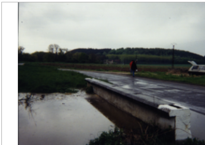
Vue du site BDHE 6 point de repère 7