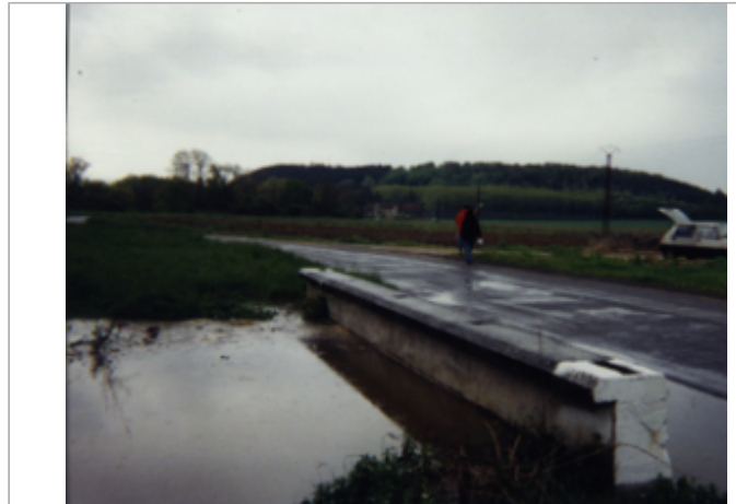
Vue du site BDHE 6 point de repère 7

Coordonnées WGS84 : X: 3.06295392 / Y: 47.05248240