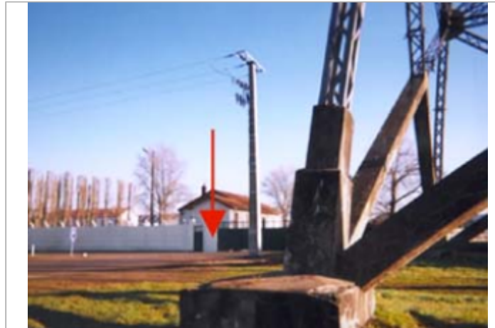
Vue du site BDHE 5 point de repère 6

Coordonnées WGS84 : X: 3.07664990 / Y: 47.03113640