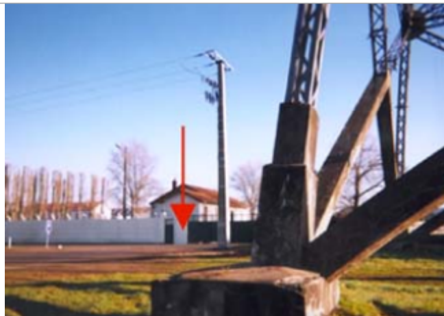
Vue du site BDHE 5 point de repère 6