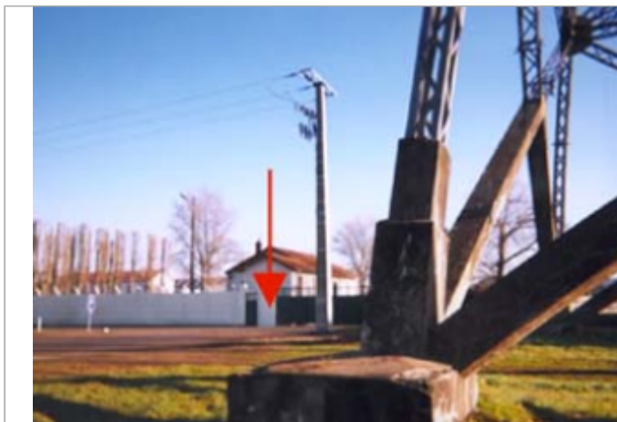
Vue du site BDHE 5 point de repère 6