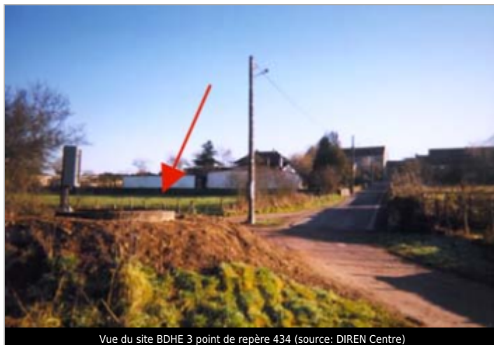
Vue du site BDHE 3 point de repère 434