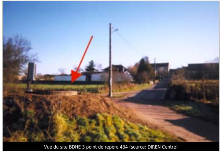
Vue du site BDHE 3 point de repère 434

Coordonnées WGS84 : X: 3.07167910 / Y: 46.99645860