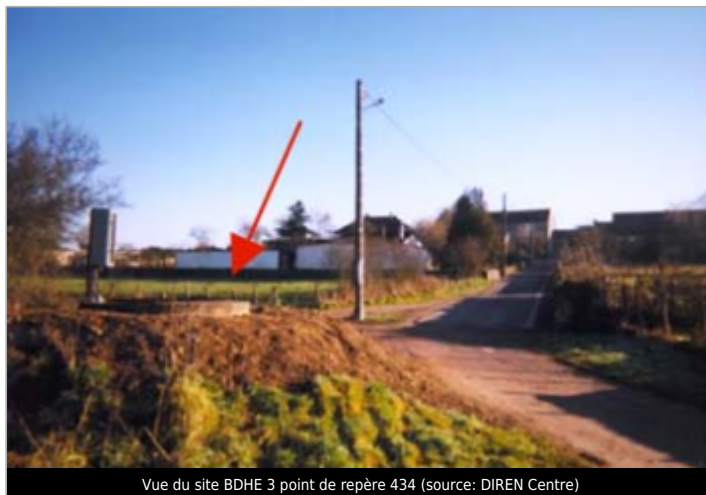
Vue du site BDHE 3 point de repère 434