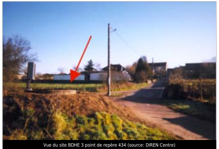
Vue du site BDHE 3 point de repère 434

Coordonnées WGS84 : X: 3.07167910 / Y: 46.99645860