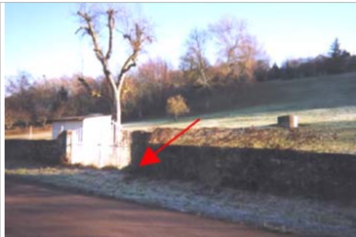
Vue du site BDHE 2 point de repère 3

Coordonnées WGS84 : X: 3.07336531 / Y: 46.96872690