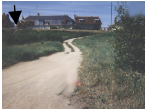
Vue du site BDHE 1 point de repère 1

Coordonnées WGS84 : X: 3.07727055 / Y: 46.95875750