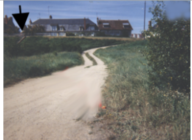
Vue du site BDHE 1 point de repère 1