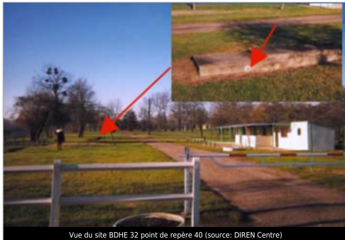
Vue du site BDHE 32 point de repère 40

Coordonnées WGS84 : X: 2.94206292 / Y: 47.28754960