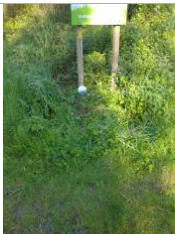
Vue du repère - Auteur : SMBGP