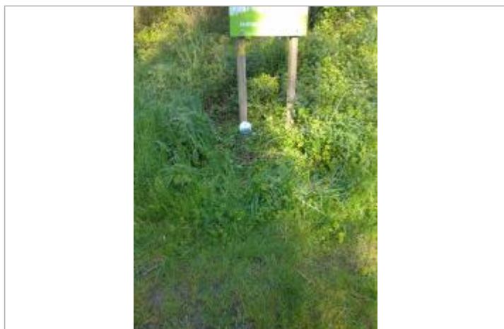
Vue du repère - Auteur : SMBGP