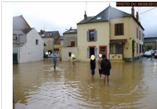
Vue de la photo en 2013

Altitude calculée de l'eau (en m) : 272.981