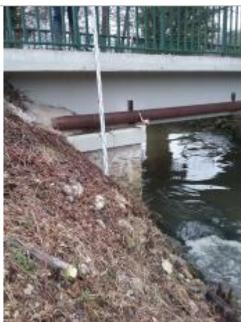
Vue de la marque