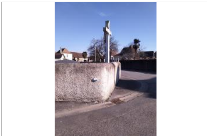
Vue du site depuis la route de muret