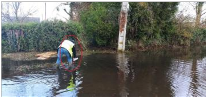
Laisse de crue sur panneau