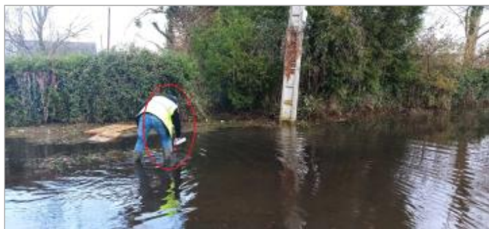
Laisse de crue sur panneau