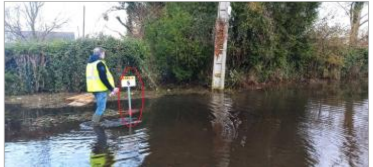
vue depuis la RD580

Coordonnées WGS84 : X: 0.29427765 / Y: 49.40932610