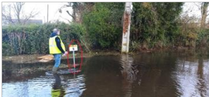
vue depuis la RD580