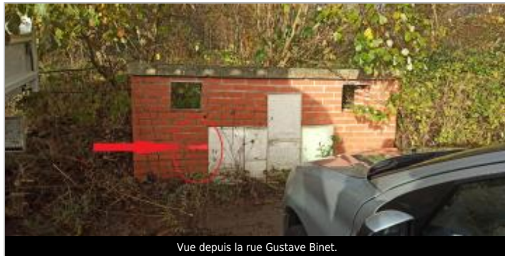
Vue depuis la rue Gustave Binet.

Coordonnées WGS84 : X: 0.27141279 / Y: 49.40485370