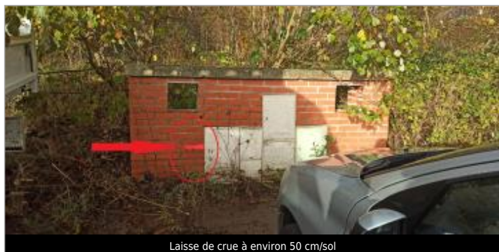
Laisse de crue à environ 50 cm/sol