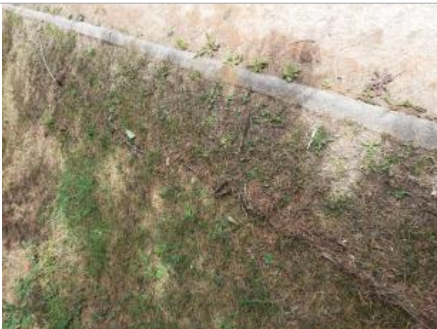
axe de ruissellement sur la route de Maromme matérialisé par laisse de végétation sur bande enherbée