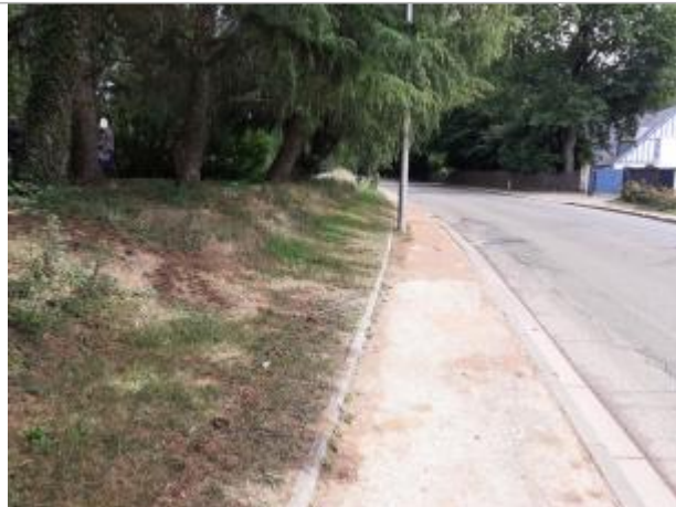
bande enherbée côté bassin de rétention