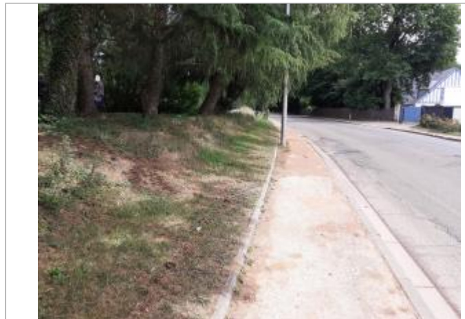
bande enherbée côté bassin de rétention