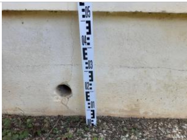
Vue de la marque

SOURCE DE REPÉRAGE : SPC SMYL - 21/01/2020