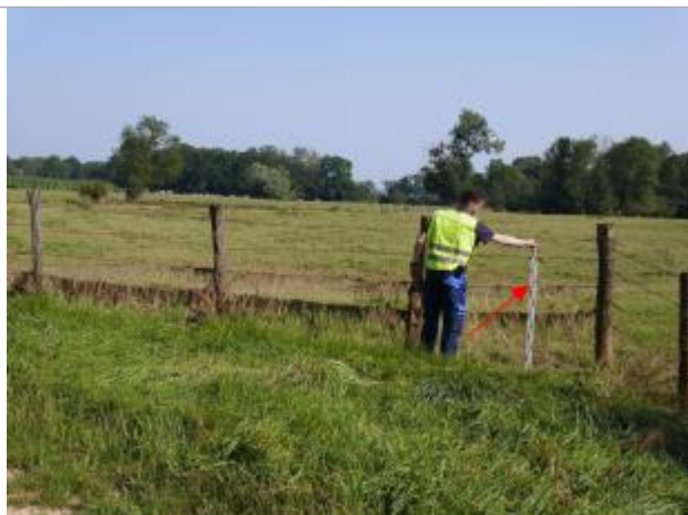
Vue de la marque

SOURCE DE REPÉRAGE : SPC SMYL - 21/01/2020