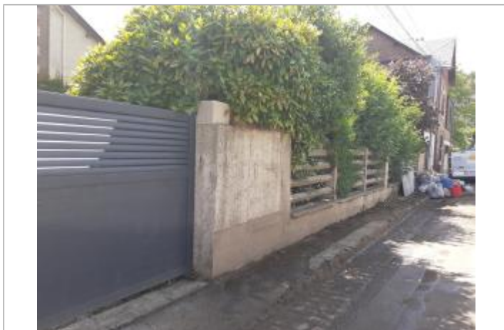
muret extérieur côté rue de la Fraternité

Coordonnées WGS84 : X: 1.08838380 / Y: 49.45826440