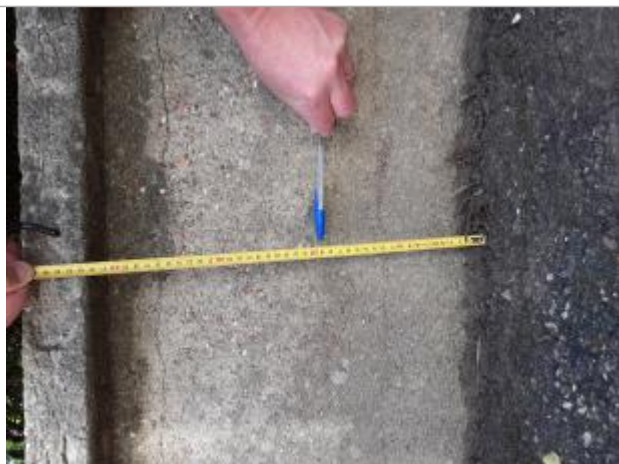
Laisse d'inondation à 19 cm du sol