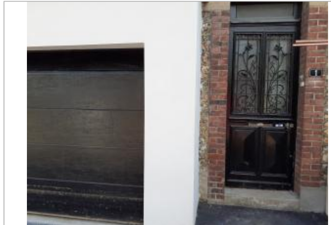
Porte de garage donnant sur la rue