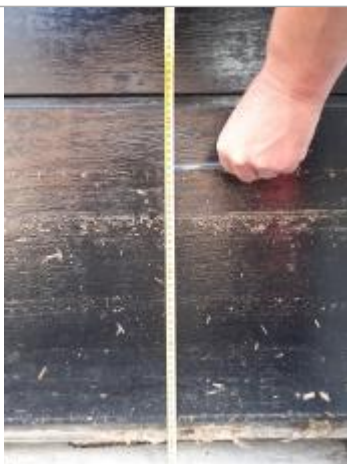
Trace d'eau boueuse sur porte garage à environ 38 cm du sol