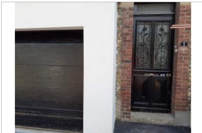
Porte de garage donnant sur la rue