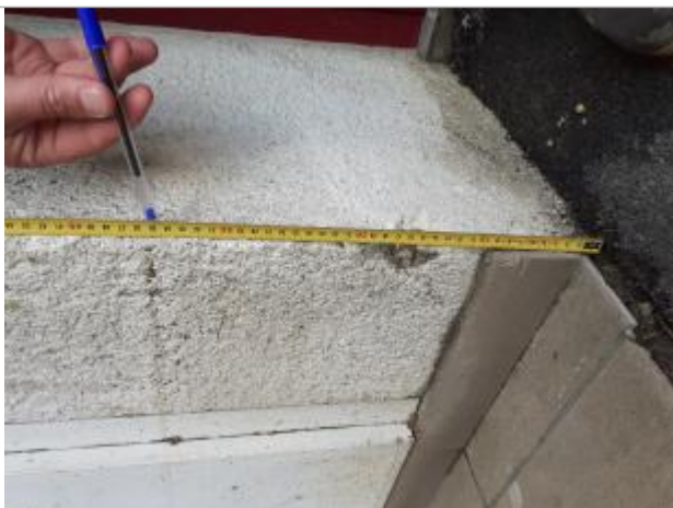
Trace d'eau boueuse à 35 cm du sol bitumé sur mur extérieur du hall d'entrée