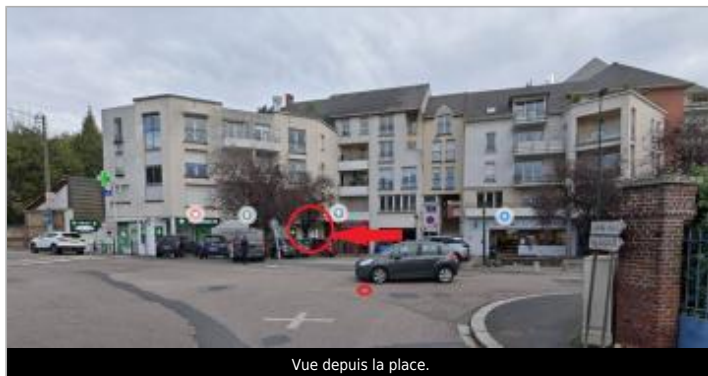
Vue depuis la place.