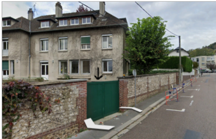
Porte de garage semi-enterré à l'intérieur de la résidence