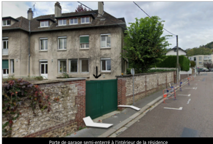
Porte de garage semi-enterré à l'intérieur de la résidence