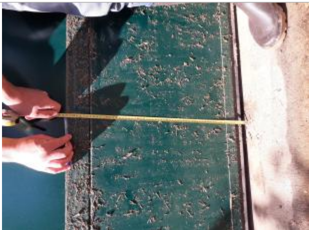
trace d'eau boueuse sur porte de garage semi-enterré à environ 60 cm du sol