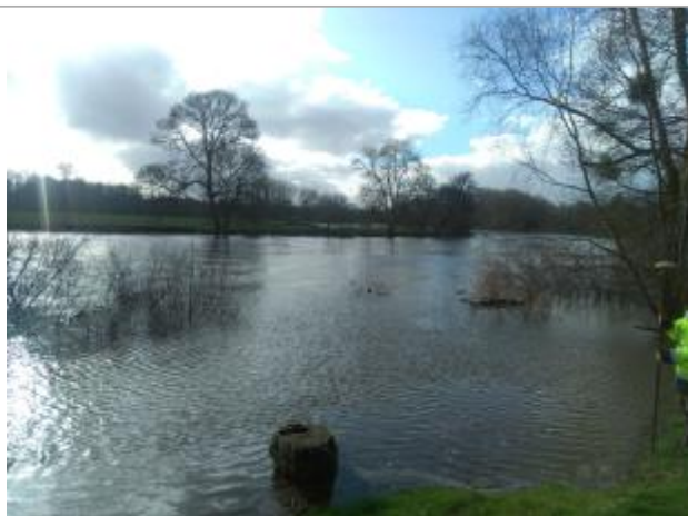
Vue rapprochée de la mesure en 2021

Altitude calculée de l'eau (en m) : 127.381 m