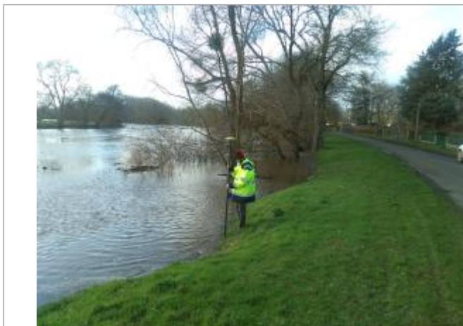
Vue du site en 2021

Coordonnées WGS84 : X: 2.28338611 / Y: 46.93836850