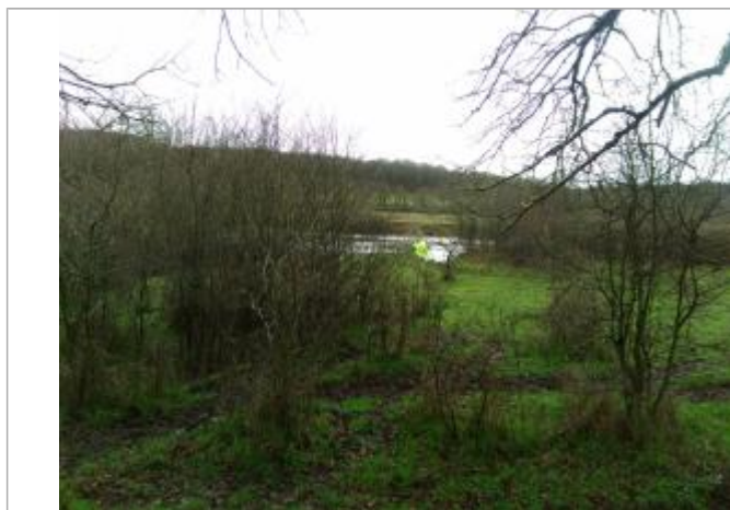
Vue rapprochée de la mesure en 2021