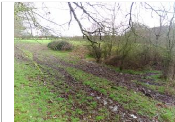
Vue du site en 2021

Coordonnées WGS84 : X: 2.43903123 / Y: 46.74788510