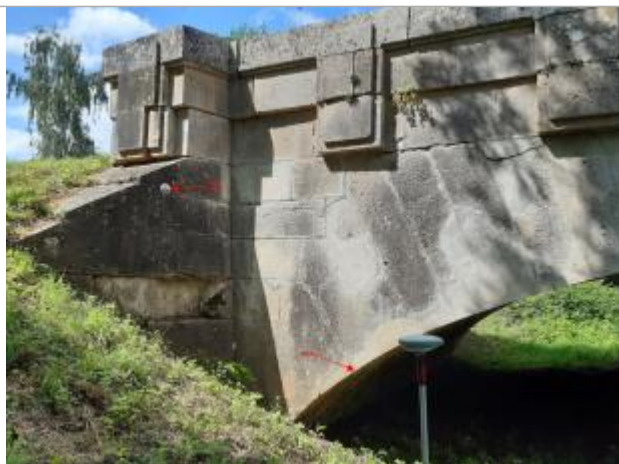
Vue de la marque

SOURCE DE REPÉRAGE : SPC SMYL - 21/01/2020