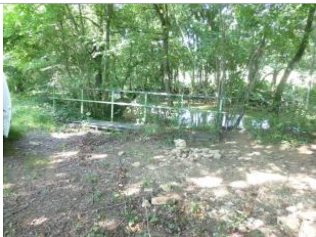
Vue de la marque

SOURCE DE REPÉRAGE : RELEVÉ DE LAISSES SUR LA BRENNESUITE À LA CRUE DE JUILLET 2021 - 21/07/2021