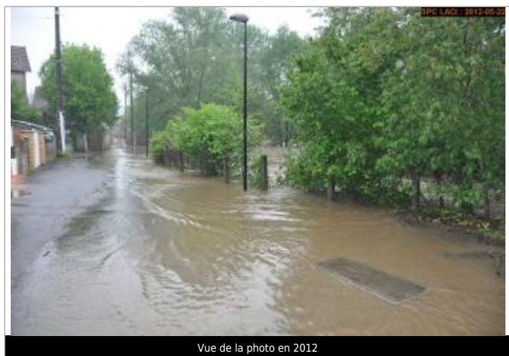
Vue de la photo en 2012

SOURCE DE REPÉRAGE : SPC LACI, CAMPAGNE DE RECENSEMENT 2023 - 12/06/2023