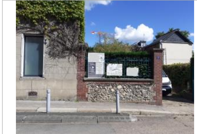
laisse de végétation sur grille d'aération cave